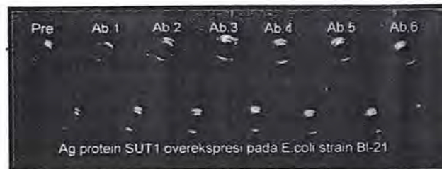
Gambar 1. Hasil uji Ouchterlony antibodi poliklonal SUT1 dengan antigen protein rekombinan SUT1 Pre- serum pre-imunisasi Ab.1-Ab.6: serum antibodi Poliklonal SUT1 minggu ke-5 -10.

Deteksi titer antibodi dilakukan dengan uji Western Blot . Antigen yang digunakan adalah protein rekombinan SUT1 hasil over ekspresi E. coli dengan konsentrasi yang berbeda yaitu 10 \mu\text{g} , 1 \mu\text{g} , 0.1 \mu\text{g} , 0.01 \mu\text{g} , dan 0.001 \mu\text{g} . Uji