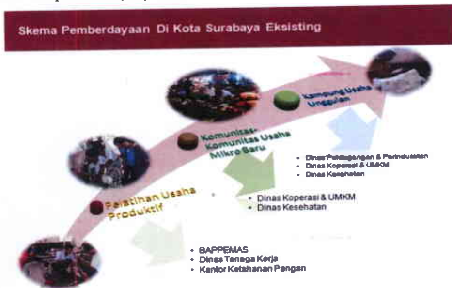
Gambar 1. Model Pemberdayaan Masyarakat Melalui Pelatihan UMKM Berjenjang

Untuk lebih jelasnya model pemberdayaan masyarakat melalui pelatihan UMKM Berjenjang tersebut dapat digambarkan sebagai berikut: