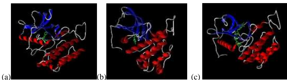
Gambar 2. Gambaran 3-D target reseptor VEGFR2 dalam bentuk backbone dengan ligan N -(benzoil)- N' -feniltiourea (a), N -(3,4-dimetilbenzoil)- N' -feniltiourea (b) dan senyawa pembanding sorafenib (c)

Dengan mempertimbangkan senyawa yang diprediksi mempunyai aktivitas sitotoksik paling tinggi dan tidak toksik, maka dipilih senyawa nomor 5 yaitu N -(3,4-dimetilbenzoil)- N' -feniltiourea (nilai RS = 105,792 ) yang tidak mempunyai efek hepatotoksik serta efek toksisitas lainnya. Sehingga senyawa yang terpilih untuk bisa dilanjutkan dengan sintesis adalah N -(3,4-dimetilbenzoil)- N' -feniltiourea. Gambaran 3-D target reseptor VEGFR2 kode PDB: 3WZE dalam bentuk back bone dengan turunan N -(benzoil)- N' -feniltiourea dan senyawa pembanding sorafenib dapat dilihat pada gambar 2.