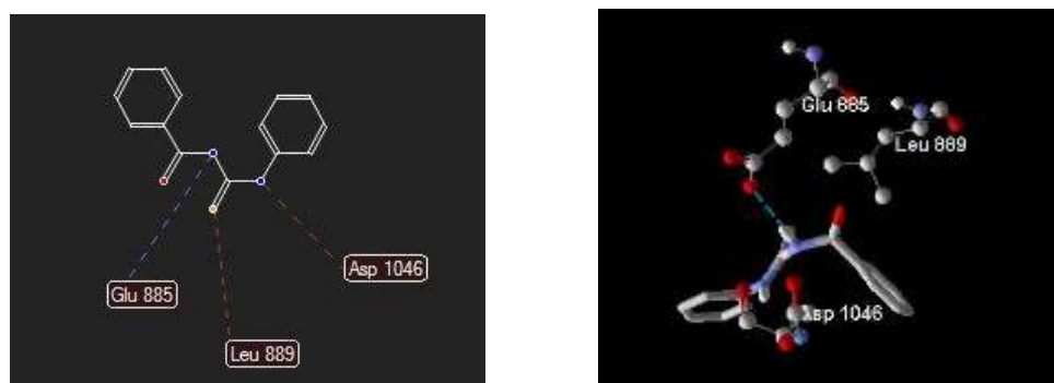
Gambar 3. Gambaran 2-D dan 3-D dari interaksi antara senyawa induk N -(benzoil)- N' -feniltiourea, dengan target reseptor VEGFR2

Gambaran 2-D dan 3-D dari interaksi antara senyawa induk N -(benzoil)- N' -feniltiourea, N -(3,4-dimetilbenzoil)- N' -feniltiourea dan senyawa pembanding sorafenib dengan target