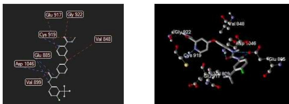
Gambar 5. Gambaran 2-D dan 3-D dari interaksi antara senyawa senyawa pembanding Sorafenib dengan target reseptor VEGFR2