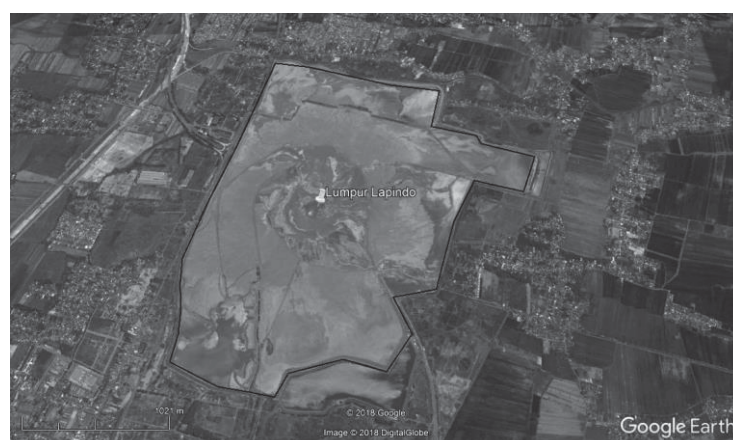
Gambar 1. Peta lokasi lumpur Lapindo

Luasan area penempatan panel ditentukan dengan Google Earth menggunakan fitur Polygon , yakni penghitungan jarak dan/atau luas dari bentuk geometris [2]. Lokasi pemasangan ditunjukkan pada Gambar 1 yang di generate dari Google Earth . Posisi astronomis lokasi adalah 7^{\circ}31'42.59'' S 112^{\circ}43'00.65'' E.