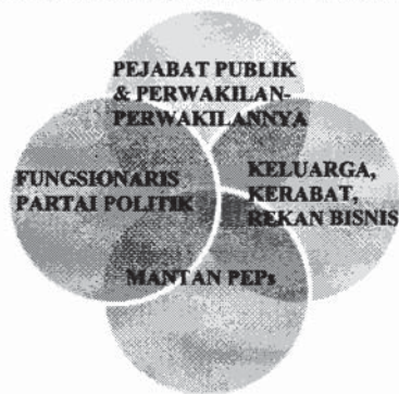
Gambar 2. Ruang Lingkup Rumusan PEPs 40