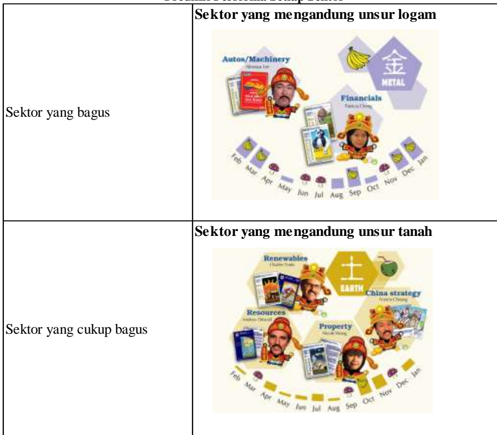
Tabel 5. Prediksi Performa Setiap Sektor