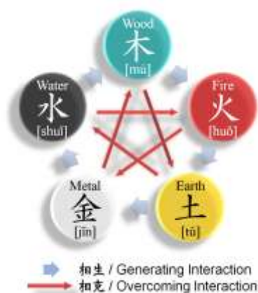
Gambar 1. Generating Cycle (生, shēng ) & Overcoming Cycle (剋/克, kè )

Setiap sektor bisnis dapat dikaitkan dengan masing-masing elemen dalam feng shui (tabel 4).