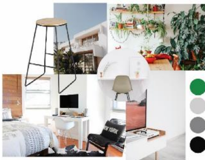
Gambar 4. Mood Board

Perkembangan gaya hidup masyarakat urban terutama kegunaan ruang publik seperti café, CoWorking Space, Home Library memicu tingginya permintaan dekorasi rumah yang dapat memadai dan memperindah ruang publik tersebut. Adapun pot tanaman yang menjadi salah satu produk yang digunakan sebagai dekorasi untuk mempercantik dan mendukung konsep gaya desain yang ada pada ruang publik tersebut. Oleh karena itu, pembuatan pot tanaman yang dapat mendukung konsep gaya desain pada ruang publik menjadi penting, sehingga pengguna dapat menikmati suasana yang alami pada ruangan, sehingga kegiatan yang dikerjakan pada ruang publik menjadi lebih nyaman dan hidup. Produk yang dibuat sengaja memperlihatkan material aslinya tanpa finishing karena trend estetika saat ini baik interior maupun benda produk lebih banyak yang mengarah pada desain industrial atau scandinavian dengan gaya dinding ruang dan perabot tanpa finishing atau memasukkan unsur alam kedalamnya.