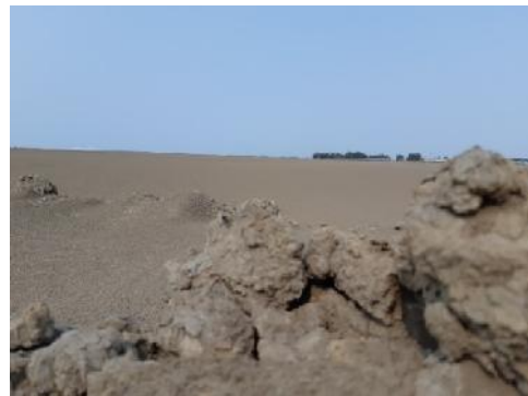
Gambar 1. Lumpur Lapindo Prong Sidoarjo yang terletak disekitar tanggul

Observasi untuk mengetahui keadaan lumpur mana yang akan digunakan untuk pengambilan material. Lumpur Lapindo sebagian besar sudah mengering, sehingga banyak yang sudah membentuk semacam batuan. Material lumpur sebagian sudah mengering menjadi pasir, sehingga dapat dengan mudah diambil untuk diolah menjadi sebuah produk.