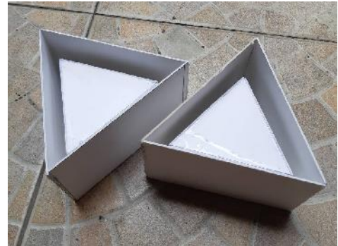
Gambar 3. Cetakan yang terbuat dari bahan plastik maket

Setelah dibuat gambar desain dengan digital maka langkah selanjutnya adalah membuat cetakan dengan menggunakan plastik maket.