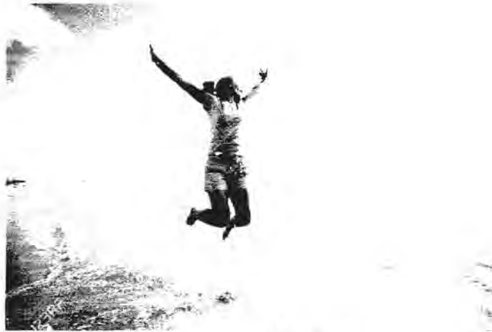
Happiness penanda Well being

Ada tiga istilah yang digunakan untuk menggambarkan diri seseorang, yaitu health , disease , illness atau sickness . Health mengacu pada kondisi dimana seseorang tidak mengalami illness ataupun sickness . Health illness atau sickness merupakan penghayatan pribadi dan bisa juga merupakan pranata sosial mengenai terganggu atau tidaknya seseorang. Sickness merupakan suatu kondisi yang didasarkan diagnosa yang diberikan profesional mengenai gangguan yang dimiliki seseorang setelah melalui serangkaian prosedur pemeriksaan yang sistematis.