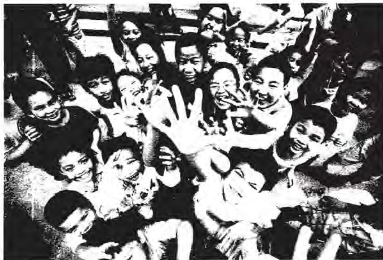
Kebahagiaan yang tercermin dalam komunitas

Penelitian membuktikan bahwa definisi tentang sehat, berbeda untuk golongan sosial yang berlainan, termasuk usia, gender dan persepsi tentang kesehatan yang dimiliki. Survey yang dilakukan oleh Health & lifestyle survey menunjukkan bahwa pria muda mendefinisikan sehat sebagai bentuk kekuatan fisik. Perempuan mendefinisikan sehat sebagai bentuk vitalitas atau energy untuk dapat melakukan sesuatu serta kemampuan untuk melakukan coping. laki-laki dan perempuan usia lanjut memiliki konsep sehat sebagai bentuk kenyamanan dan perasaan bahagia. Perempuan pada berbagai golongan usia menempatkan hubungan personal yang baik dengan orang lain sebagai kriteria untuk menentukan sehat atau tidaknya kondisi yang dialaminya (Brown, 2004). Pandangan sosiologis mengenai sehat dan sakit analog dengan konsep illness atau sickness