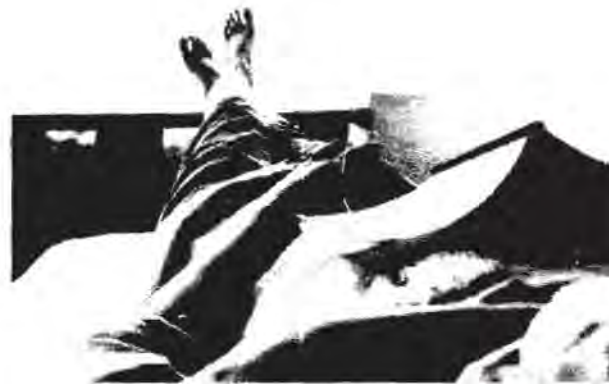
Mampu menikmati hari dengan bahagia

Batasan psikologis ini bersifat samar, karena tidak ada kriteria yang pasti yang dapat dinyatakan sebagai pedoman baku. Batasan tentang gembira dan sedih, misalnya bersifat relatif. Seseorang bisa merasakan gembira dan sedih sekaligus dalam interval waktu yang tidak lama. Penghayatan psikologis mengenai sehat dan sakit analog dengan konsep illness atau sickness .