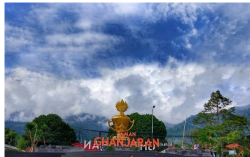
Gambar 1. Pembukaan Taman Ghanjaran selama masa pandemik