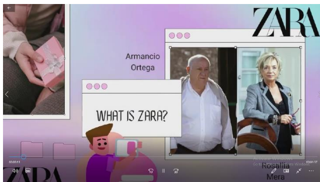
Penjelasan perusahaan Zara