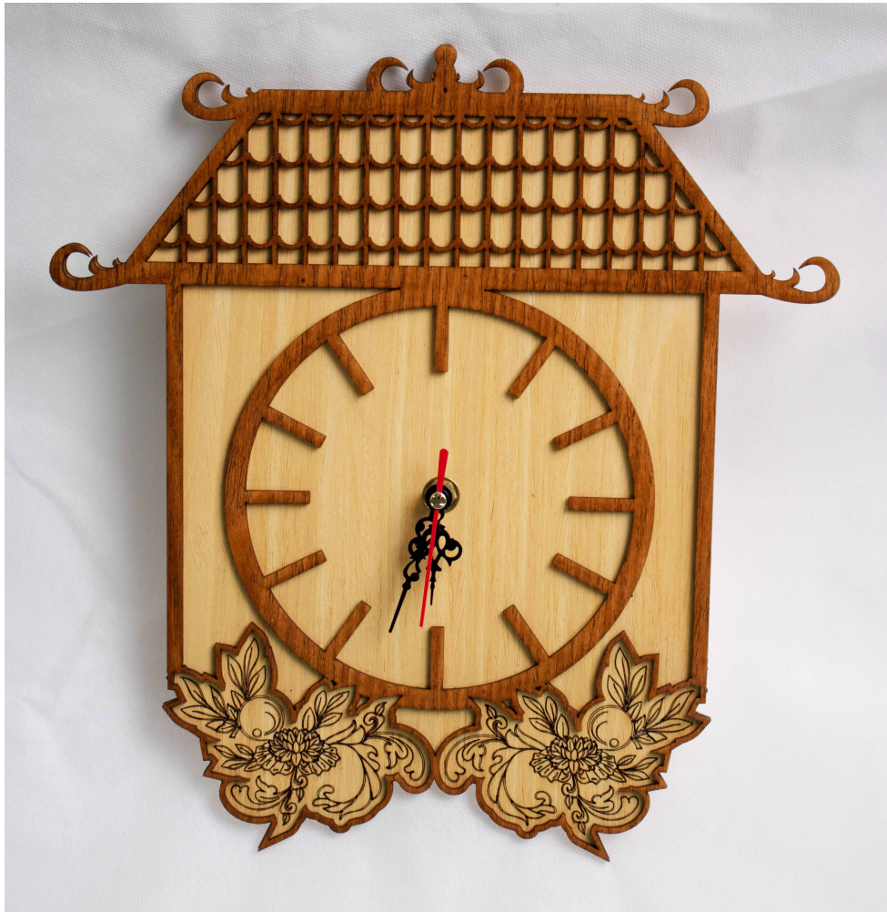
Tampak Referensi 1