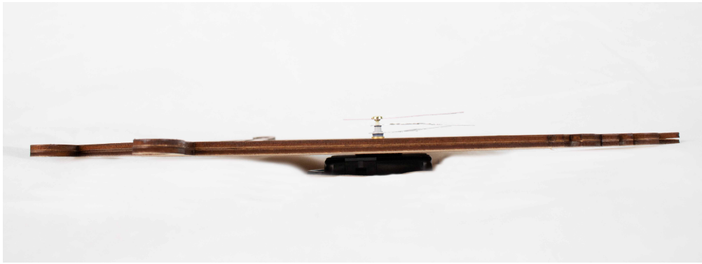
Tampak Samping Kiri