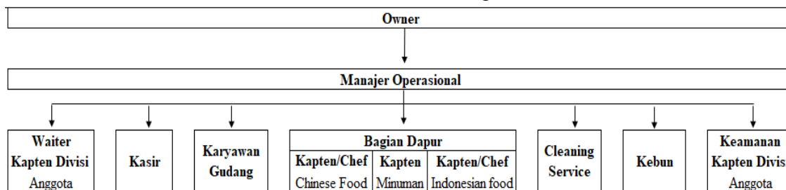
Gambar 2. Struktur organisasi ABC