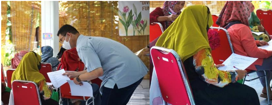
Gambar 5. Pembagian dan pengisian pre-test dan post-test .

Jamil, 2019). Pemberian lembar kuesioner pre-test dan post-test serta kegiatan mitra dalam pengisian kuesioner dapat dilihat pada Gambar 5.