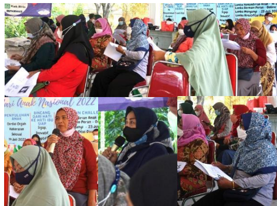
Gambar 4. Antusiasme peserta dalam mengikuti kegiatan penyuluhan dan sesi tanya jawab

Peserta mendengarkan penjelasan narasumber dan mempelajari materi yang dibagikan dalam bentuk hardcopy selama kurang lebih 45 menit, kemudian diikuti dengan sesi tanya jawab. Pada sesi tanya jawab, antusiasme mitra terlihat dari banyaknya pertanyaan yang diajukan kepada narasumber, yaitu sebanyak 5 orang. Pertanyaan yang diajukan lebih banyak terkait komponen materi sistem imun, pangan fungsional dan diversifikasi produk. Demi memberikan apresiasi terhadap mitra yang mengajukan pertanyaan, panitia pelaksana PKM memberikan penghargaan berupa hadiah. Aktivitas mitra dan sesi tanya jawab dapat dilihat pada Gambar 4.