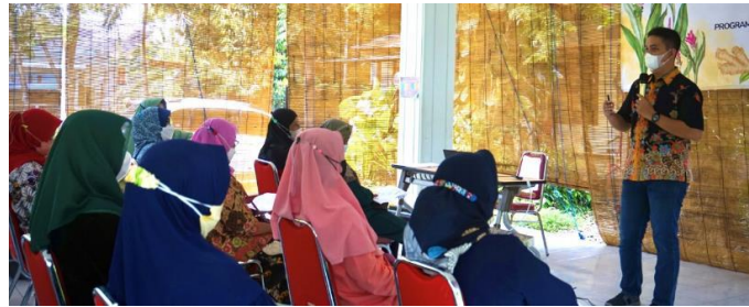
Gambar 3. Penyampaian materi penyuluhan oleh narasumber

produk. Dokumentasi penyampaian materi penyuluhan dapat dilihat pada Gambar 3.