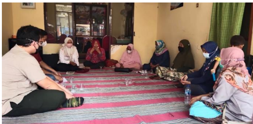
Gambar 2. Diskusi Persiapan Kegiatan dengan Kader PKK RW 06

Diskusi dengan kader ibu-ibu PKK RW 06 didapatkan kesepakatan waktu dan tempat kegiatan yaitu pelaksanaan penyuluhan dilakukan pada hari Minggu, tanggal 31 Juli 2022 di Pusdakota (Pusat Pemberdayaan Komunitas Perkotaan) Universitas Surabaya. Dokumentasi diskusi dapat dilihat pada gambar 2. Perijinan tempat dan persiapan seluruh kebutuhan kegiatan penyuluhan dapat dikoordinasikan dengan baik oleh tim PKM. Hasil kuesioner penentuan produk diversifikasi pangan fungsional berbahan jahe diambil 4 produk yang memiliki jumlah responden terbanyak dan terpilih untuk dijadikan perencanaan materi penyuluhan dan pelatihan. Keempat produk tersebut yaitu sirup jahe dengan 12 responden (30%), permen gummy 9 responden (22,5%), stik jahe 9 responden (22,5%) dan teh jahe 9 responden (22,5%). Hasil pemilihan produk dapat dilihat pada Gambar 2 dan Tabel 1.