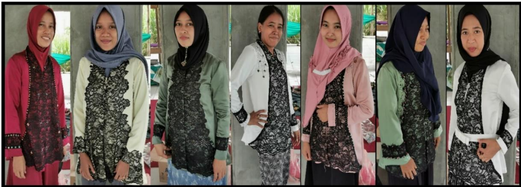
Gambar 3. Produk Hasil Jadi Pelatihan Menjahit Halus

Pendampingan selanjutnya yaitu meletakkan pola baju pada kain (material kain dan bahan penunjang telah disiapkan sebelumnya oleh tim PKM). Setelah pola diletakkan pada kain kemudian dilakukan cutting, coding, sewing, dan finishing. Gambar 3 merupakan hasil jadi dari pelatihan menjahit halus yang telah di kenakan oleh masing-masing masyarakat sasaran yang mengikuti pelatihan.