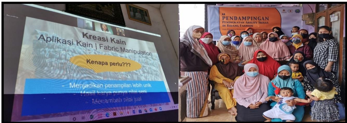
Gambar 1. Fashion Workshop diselenggarakan Secara Hybrid

Beberapa informan juga menyatakan bahwa materi kedua membuka wawasan masyarakat sasaran bahwa kain yang biasa dengan harga yang murah bisa menjadi mahal dengan diberikan sentuhan dari kain-kain sisa yang dibentuk menjadi aplikasi dan ditempel dan dijahit menggunakan teknik tertentu (I-3, I-4, I-5, dan I-6). Materi tentang fabric manipulation memberikan pengetahuan dijelaskan oleh semua informan dengan pernyataannya bahwa kain yang dihias akan memberikan nilai tambah pada harga jualnya. Materinya menarik dan memberikan ide baru untuk membuat kreasi sendiri (I-1, I-2, I-3, I-4, I-5, I-6, dan I-7).