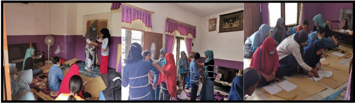
Gambar 2. Pelatihan Mengukur Badan dan Membuat Pola Baju

Pendampingan selanjutnya yaitu meletakkan pola baju pada kain (material kain dan bahan penunjang telah disiapkan sebelumnya oleh tim PKM). Setelah pola diletakkan pada kain kemudian dilakukan cutting, coding, sewing, dan finishing. Gambar 3 merupakan hasil jadi dari pelatihan menjahit halus yang telah di kenakan oleh masing-masing masyarakat sasaran yang mengikuti pelatihan.