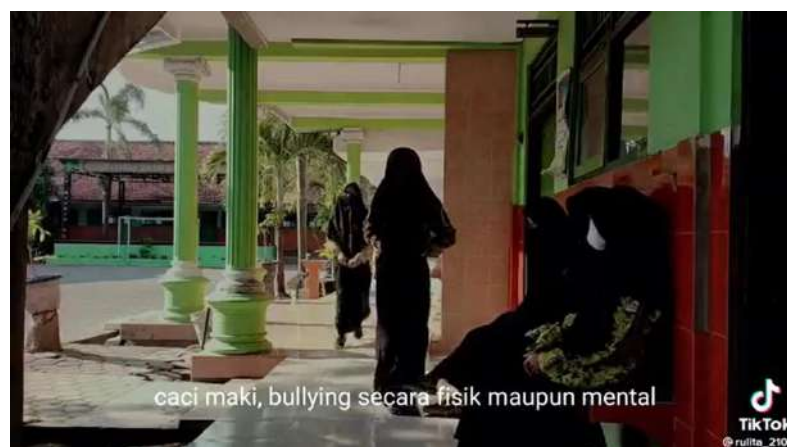
Gambar 2. Contoh cuplikan video pendek perundungan (akun tiktok @Rulita, 2105)

Sesi kedua: tim pengabdian menampilkan video pendek terkait perundungan yang diambil dari tiktok dengan durasi lebih kurang tiga menit. Selanjutnya tim pengabdian memberikan kuis yang bertujuan untuk membangun semangat dan melihat bagaimana empati siswa-siswi mitra pengabdian ketika diperlihatkan video terkait perundungan. Contoh cuplikan video yang diberikan dapat dilihat pada Gambar 2.