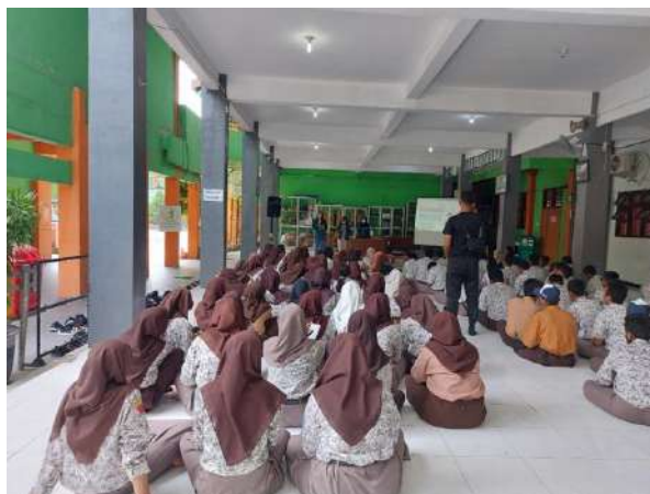
Gambar 3. Pelaksanaan kegiatan

Dalam pelaksanaan kegiatan program psikoedukasi, seluruh peserta pengabdian terlibat secara tertib dan antusias dalam seluruh kegiatan sebagaimana dapat dilihat di gambar 3. Di awal kegiatan psikoedukasi tim pengabdian melakukan pre-test untuk mengetahui pengetahuan mitra pengabdian tentang perundungan dan empatinya terhadap korban perundungan.