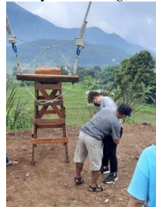
Gambar 2. Pelatihan Praktik 1

nara sumber dengan karyawan Garten Swing. Hal ini sebagai bentuk pendampingan pelatihan Garten Swing. Pada tahap kedua pelatihan ini lebih banyak terjadi diskusi antara nara sumber, karyawan swing , dan mahasiswa.