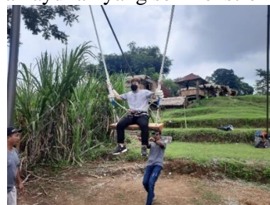
Gambar 3. Pelatihan Praktik 2

Garten Swing merupakan permainan outdoor memiliki dua fungsi utama bagi pemain. Pertama, pemain mendapatkan kesempatan dan mengembangkan berbagai jenis kemampuan. Kedua, pemain dapat mengembangkan kecerdasan sosial dan emosionalnya (Dahlan, 2019). Ayunan yang ada di Gartenhutte bersifat permanen, di mana bangunan ayunan ini sudah dipasang secara tetap dan tidak dapat dipindah-pindah. Perawatan dan penjagaan pada permainan outdoor sangat penting dilakukan mengingat permainan outdoor banyak diminati oleh pengunjung Gartenhutte dan termasuk permainan ayunan yang semi-ekstrem.