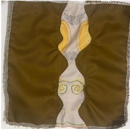
Gambar 6. Panel Two Tone .

Pada Gambar 6 merupakan eksperimen pertama. Pada eksperimen pertama menggunakan kain katun yang bersifat lembut dengan tekstur ringan, tahan cuci kering, tahan setrika dan suhu panas [23].