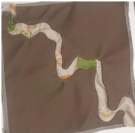
Gambar 7. Panel Two Tone 2 .

Gambar 7 merupakan hasil jadi dari eksperimen kedua. Pada eksperimen kedua peneliti menggunakan kain dengan tekstur kaku, tebal dan kokoh. Hasil pada eksperimen kedua tampak lebih rapi walaupun menerapkan cutting dengan garis lengkung dan berliku yang menerapkan hasil analisis visual dari perjalanan mudik.