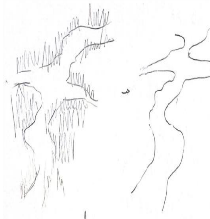
Gambar 3. Gambar Sketsa Hasil Analisis Perjalanan Panjang Mudik