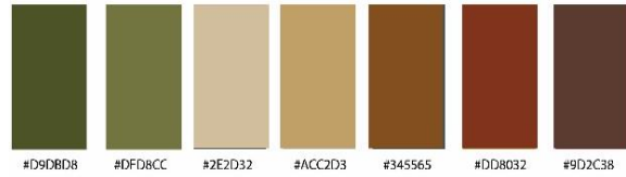
Gambar 5. Warna Emosi Gambaran Perasaan dari Hiruk Pikuk Perjalanan Mudik

bentuk dalam textile manipulation berupa panel two tone . Peranan garis hasil stilasi dari inspirasi mulih dilik atau mudik ini sangat penting untuk sampai pada tahap perwujudan, oleh karena itu hasil garis berliku dapat diterapkan dalam rancangan desain pada karya dibidang fashion [19].