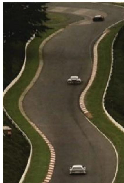
Gambar 2. Analisa Perjalanann Panjang: Garis Berliku

Analisa visual dilakukan dengan tujuan untuk membantu dan menggambarkan secara keseluruhan hasil data yang dikumpulkan baik itu berfokus dalam menjabarkan elemen visual seperti warna, bentuk, dan garis [17]. Analisa visual dari tiga kata kunci utama yang menggambarkan keseluruhan makna perjalanan pulang kampung atau mudik.