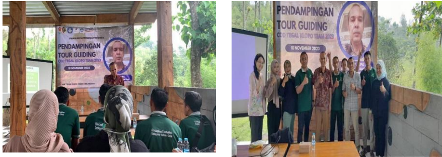
Gambar 6. Pelatihan dan Pendamping Tour Guiding