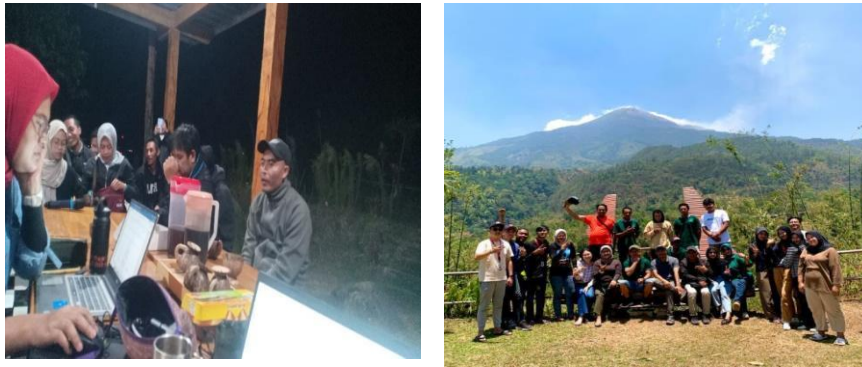
Gambar 10. Pendampingan Paket Wisata Camping

menyesuaikan paket wisata mereka dengan tren pasar dan kebutuhan wisatawan, serta meningkatkan daya saing destinasi mereka di pasar pariwisata yang semakin kompetitif.