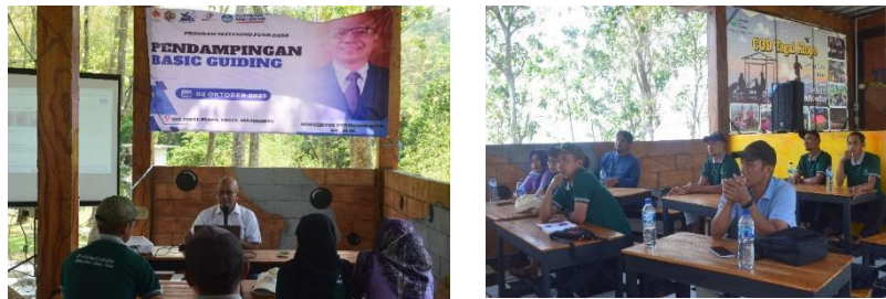
Gambar 5. Pelatihan dan Pendampingan Pengembangan Kemampuan sebagai Pemandu Wisata

Dalam sebuah wisata harus ada sesuatu yang bagi wisatawan tersebut tidak mahal tetapi menimbulkan kenangan seperti souvenir tadi, sapaan-sapaan kepada pengunjung seperti itu. Pendampingan ini diharapkan dapat menjadi langkah awal yang mengarah pada peningkatan kualitas pengelolaan destinasi wisata lokal, serta mendorong pertumbuhan ekonomi yang inklusif bagi masyarakat sekitar. Pendampingan ini diharapkan menjadi tonggak penting bagi pengembangan pariwisata yang bertanggung jawab di COD Tegal Klopo, membuka peluang baru bagi pertumbuhan sektor pariwisata lokal yang berdaya saing tinggi.