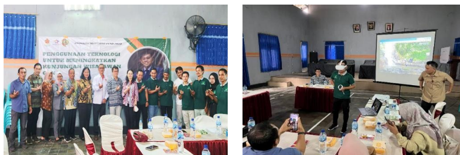
Gambar 2. Pelatihan Manajemen Pariwisata dengan Tema: Penggunaan Teknologi untuk Meningkatkan Kunjungan Wisatawan Gen Z

COD Tegal Klopo dalam sistem booking yang awalnya manual hanya dengan via telepon atau datang langsung harus diganti dengan berbasis teknologi.