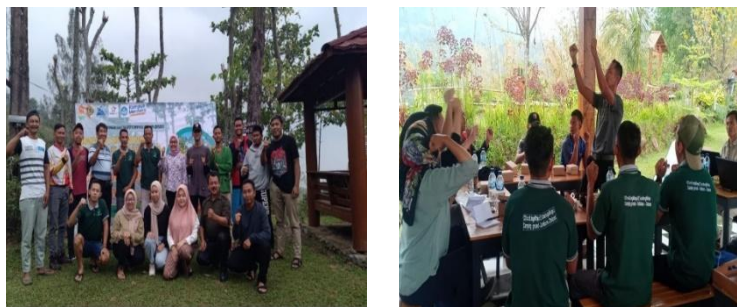
Gambar 8. Training of Trainer (ToT) Bangkit Maju Bersama Menjadi Lebih Baik

Para peserta diberikan kesempatan untuk belajar langsung dari praktisi dan ahli dalam penelolaan pariwisata serta melakukan sesi praktik langsung untuk menerapkan konsep-konsep yang dipelajari. Materi-materi yang disampaikan juga dirancang untuk memungkinkan para peserta menjadi pelatih ( trainer ) yang mampu mentransfer pengetahuan dan keterampilan yang mereka peroleh kepada rekan-rekan seprofesi di lingkungan mereka.