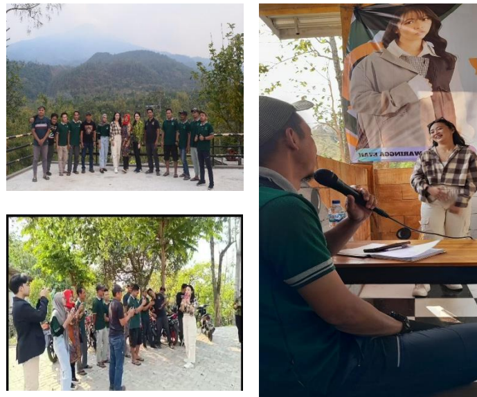
Gambar 9. Pelatihan dan Praktik Konten Creator Media Sosial

beberapa lokasi menarik di sekitar Tegal. Setelah mengikuti pelatihan dan pendampingan dari narasumber dan Tim Matching Fund Vokasi 2023 Politeknik Ubaya, COD Tegal Klopo mempunyai tambahan Media Sosial, yaitu yang semula hanya Facebook dan Instagram bertambah Tiktok , Youtube dan Website . Selain itu pengurus COD Tegal Klopo juga bisa membuat foto-foto dan video konten bagaimana mereka memperkenalkan destinasi wisata mereka ke media sosial. Hal ini diharapkan dapat memberikan pengalaman nyata bagi peserta sehingga mereka dapat mengaplikasikan secara langsung setiap konsep yang dipelajari.