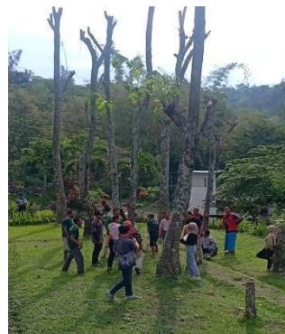
Gambar 7. Pelatihan dan Pendamping Outbond Training dan Training of Trainer