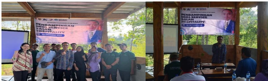
Gambar 4. Pelatihan dan Pendampingan Skill Service dalam Hospitality Bagi Pengurus COD Tegal Klopo

Selain membahas tentang strategi, narasumber juga mengatakan dalam pelayanan harus mengerti tentang Attention, Action, Ability dan Assurance . Dimana attention bisa dilakukan dengan cara memperhatikan pelanggan, lalu Action seperti pelanggan memesan area dekat mushola maka yang diberikan harus area itu juga agar tidak menimbulkan kekecewaan. Lalu harus punya ability artinya semua pengurus COD harus bisa mengelola, jangan hanya terpusat dengan satu orang. Sedangkan Assurance artinya menjamin bahwa pelanggan datang ke COD ini mendapatkan jaminan pemaparan dan pelayanan yang bagus. Hasil dari pelatihan dan pendampingan tersebut adalah bahwa Pengurus COD Tegal Klopo mengetahui bagaimana harus bersikap kepada pengunjung. Sebagai panduan untuk pengurus COD Tegal Klopo, Tim Matching Fund Vokasi 2023 Politeknik Ubaya telah membuatkan Buku Saku SOP Skill Service and Hospitality yang bisa dipelajari. Harapannya, pendampingan skill service ini akan memberikan dampak yang signifikan bagi peningkatan kualitas pelayanan hospitality di Tegal Klopo. Dengan adanya kolaborasi antara pengelola COD dan pemerintah desa, diharapkan destinasi ini mampu memberikan pengalaman wisata yang lebih memikat dan bermakna bagi setiap pengunjung.