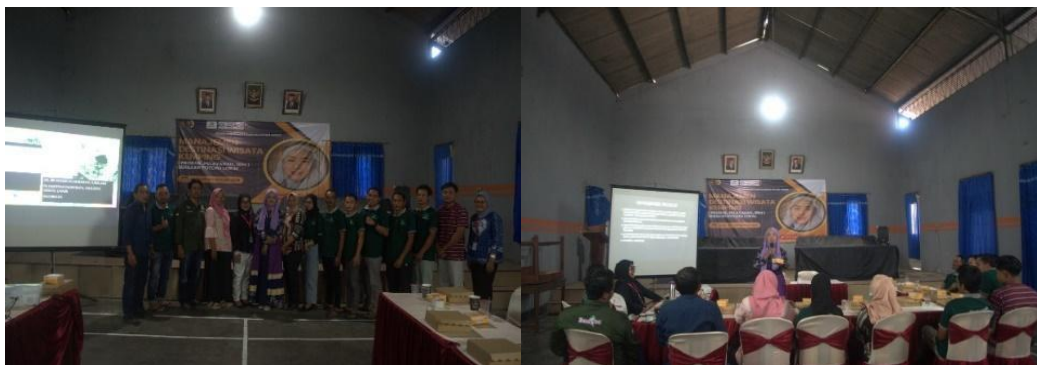
Gambar 3. Pelatihan dan Pendampingan Pengelolaan Manajemen Pariwisata (Produk, Layanan, SDM)