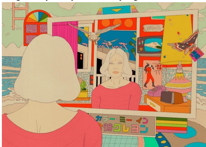
Gambar 1: “FUTURE SHORES” karya Ardneks, dari http://ardneks.com/wp-content/uploads/2019/01/6.jpg

Dari segi orisinalitasnya, karya “HYPERVENTILATION CHERRY” yang telah diciptakan tersebut merupakan karya yang bersifat orisinal bagi Ardneks. Karya “HYPERVENTILATION CHERRY” telah diciptakan berdasarkan kreativitas Ardneks yang bersifat khas dan pribadi untuk Ardneks sendiri, yang dapat terlihat dari teknik penggambaran dan pewarnaan yang dipakai oleh Ardneks, dimana teknik-teknik tersebut menggunakan gaya penciptaan karya bernuansa retro psychedelic yang unik dan khas bagi Ardneks sendiri, sebagaimana terlihat dengan karya-karya Ardneks yang lain.