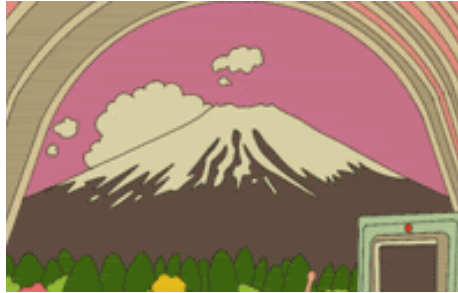
Gambar 3: Unsur Gunung dan Awan dari “Target Secured”, dari https://opensea.io/assets/ethereum/0x8ed428a5762c4b9b14e7a214fad646b25a339064/2800010026