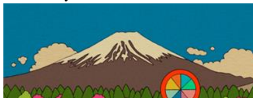
Gambar 2: Unsur Gunung dan Awan dari “HYPERVENTILATION CHERRY”, dari http://ardneks.com/wp-content/uploads/2019/01/7.jpg

Hal ini dapat dilihat dari perlindungan hukum yang dapat diperoleh oleh Ardneks atas pelanggaran hak cipta pada contoh kasus yang telah disebutkan. Pelanggaran hak cipta yang dilakukan oleh Twisted Vacancy dapat terlihat dari perbuatan-perbuatan yang dilakukan oleh pihak tersebut dalam kasus ini. Perbuatan pertama yang bisa ditinjau adalah proses dan metode penciptaan karya “Target Secured” tersebut, yaitu dengan metode bank asset . Praktek tersebut memanfaatkan unsur-unsur karya yang diambil dari internet, yang kemudian dimasukkan ke dalam penampungan unsur-unsur karya ( bank asset ), yang kemudian digunakan untuk membuat karya baru melalui praktek slashing, remixing, dan kolase. Penggunaan praktek ini dalam karya “Target Secured” terlihat dari unsur gunung dan awan karya tersebut, dimana unsur-unsur tersebut yang ditemukan dalam karya “Target Secured” memiliki kemiripan dengan unsur gunung dan awan dalam karya “HYPERVENTILATION CHERRY,” sebagaimana terlihat dari bentuk penggambaran gunung, pemilihan warna, serta cara pewarnaan, sedangkan kemiripan unsur awan pada kedua karya tersebut dapat dilihat dari bentuk penggambaran awan dan penempatan unsur awan tersebut yang mirip, khususnya yang terletak di sisi kiri gunung kedua karya tersebut.