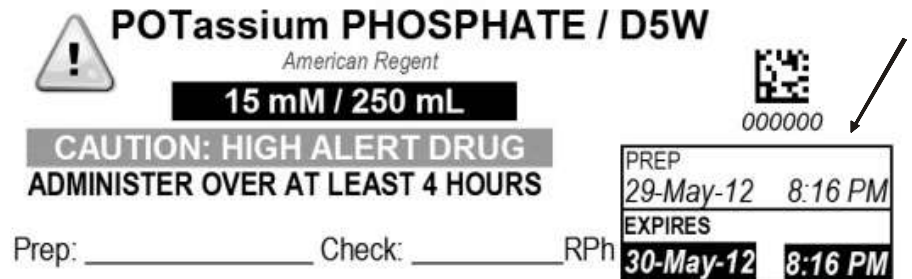
Gambar 1. Label BUD sediaan injeksi Potassium Phosphate dalam larutan Dextrose 5%

Single use dan single dose vial (SVD) sediaan injeksi diberikan hanya kepada satu pasien untuk satu kali pengobatan/prosedur. Syringe dan jarum yang telah digunakan atau diinjeksikan ke pasien, sudah terkontaminasi dan seharusnya tidak boleh digunakan kepada pasien atau vial lain. Penggunaan multi dose vial (MDV) juga sebaiknya hanya kepada satu pasien dan disimpan dalam refrigerator (2-8 °C). Sediaan single use dan single dose mengandung sedikit atau bahkan tanpa pengawet sehingga mudah terkontaminasi dan menjadi sumber infeksi. Bahkan di dalam sediaan multi dose yang mengandung pengawet, bakteri masih dapat hidup selama kurang lebih 2 jam sebelum efek pengawet maksimal. 4,5