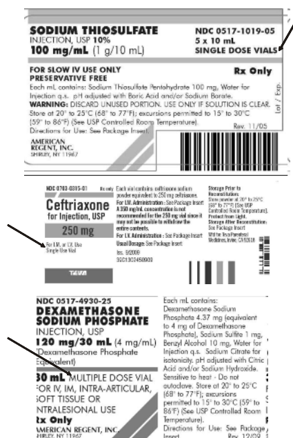
Gambar 2. Label sediaan injeksi Sodium Thiosulfate, Ceftriaxone dan Dexamethasone

Sediaan multi dose vial (MDV) berisiko menyebabkan penularan penyakit infeksi. Pada satu kajian sistematis (94 artikel) tentang kejadian luar biasa ( outbreak ) infeksi di rumah sakit terdapat 743 pasien mendapat obat/bahan obat dari vial yang terkontaminasi mengakibatkan 592 pasien menderita infeksi ( hospital-acquired infection ) dan 62 pasien diantaranya meninggal. 6 Mattner dan Gastmeier melaporkan kejadian meninggalnya 2 pasien di rumah sakit karena terinfeksi Pseudomonas aeruginosa setelah disuntik cairan kontras media iomeprol yang sudah disimpan selama 8 hari. Penelitian cross sectional yang dilakukan di rumah sakit tersebut mendapati 227 vial yang telah dibuka, 109 vial diantaranya tidak mengandung pengawet; hanya 50% vial dilengkapi dengan label tanggal vial dibuka, 13% diantaranya sudah melewati tanggal kedaluwarsa. 7 Penelitian yang dilakukan di salah satu rumah sakit di Iran menyebutkan bahwa dalam 4 bulan terdapat 36 vial terkontaminasi bakteri, terutama bakteri Staphylococcus epidermidis (16 vial). Penelitian di Florida melaporkan terjadinya penularan virus Hepatitis C akibat penggunaan multi dose vial larutan NaCl 0,9% untuk membilas jalur infus intravena. Peneliti menduga bahwa hal tersebut terjadi karena menggunakan kembali jarum yang telah terkontaminasi atau dekontaminasi tutup vial yang kurang sempurna. 8 Praktek pemberian sediaan injeksi yang tidak aman diilustrasikan pada Gambar 3.