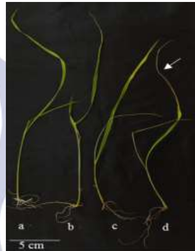
Gambar 1. Morfologi dari padi Barak Cenana yang di tanam secara fotoautotrof pada media MS dengan penambahan 0, 50, 100 atau 150 mM NaCl selama 14 hari. a. Control; b. Diberi tambahan 50 mM NaCl; c. Diberi penambahan 100 Mm NaCl; d. Diberi perlakuan 150 mM NaCl. Tanda panah menunjukkan daun yang mengalami klorosis.

di daun menunjukkan bahwa degradasi klorofil telah terjadi pada tujuh hari setelah bibit padi dicekam dengan NaCl (Gambar 2). Bibit padi yang tercekam 50 mM, 100 mM dan 150 mM NaCl secara berturut-turut memiliki kadar klorofil a 15%, 28% dan 38% lebih rendah dari kontrol. Kadar klorofil b bibit padi yang tercekam 50 mM, 100 mM dan 150 mM NaCl secara berturut-turut lebih rendah 70%, 75% dan 74% dari kontrol. Total klorofil pada daun menunjukkan bahwa laju degradasi klorofil bibit padi yang tercekam 50 mM, 100 mM dan 150 adalah sebesar 35,5%, 45,5% dan 57,34%.