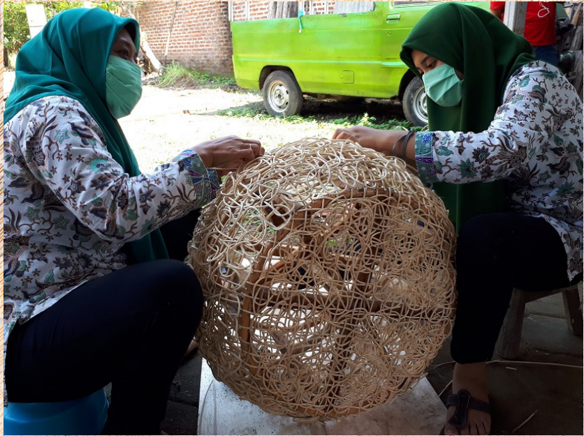
Aktivitas 5: Meningkatkan kemampuan teknologi dalam produksi