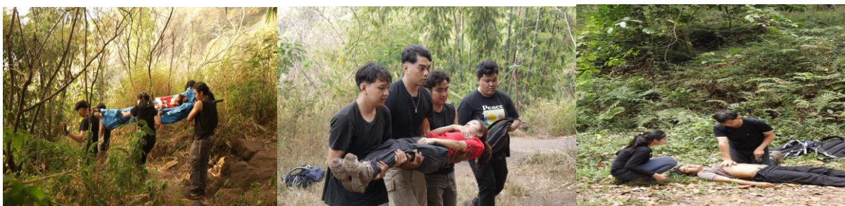
Gambar 2. Simulasi P3K, Proses Pengambilan Video di atas Gunung Penanggungan