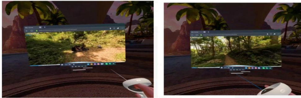
Gambar 3. Contoh Tampilan VR