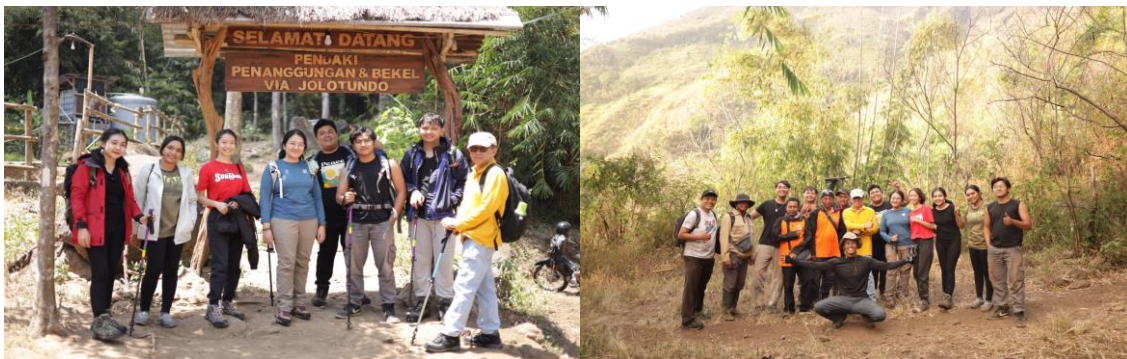
Gambar 1. Tim di Pintu Gerbang Menuju Lokasi Pendakian dan di atas gunung Penanggungan