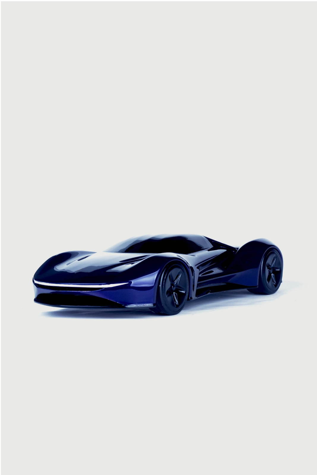
Gambar 1 - Tampak Perspektif