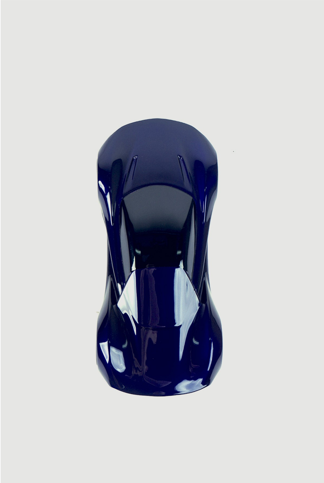
Gambar 6 - Tampak Atas