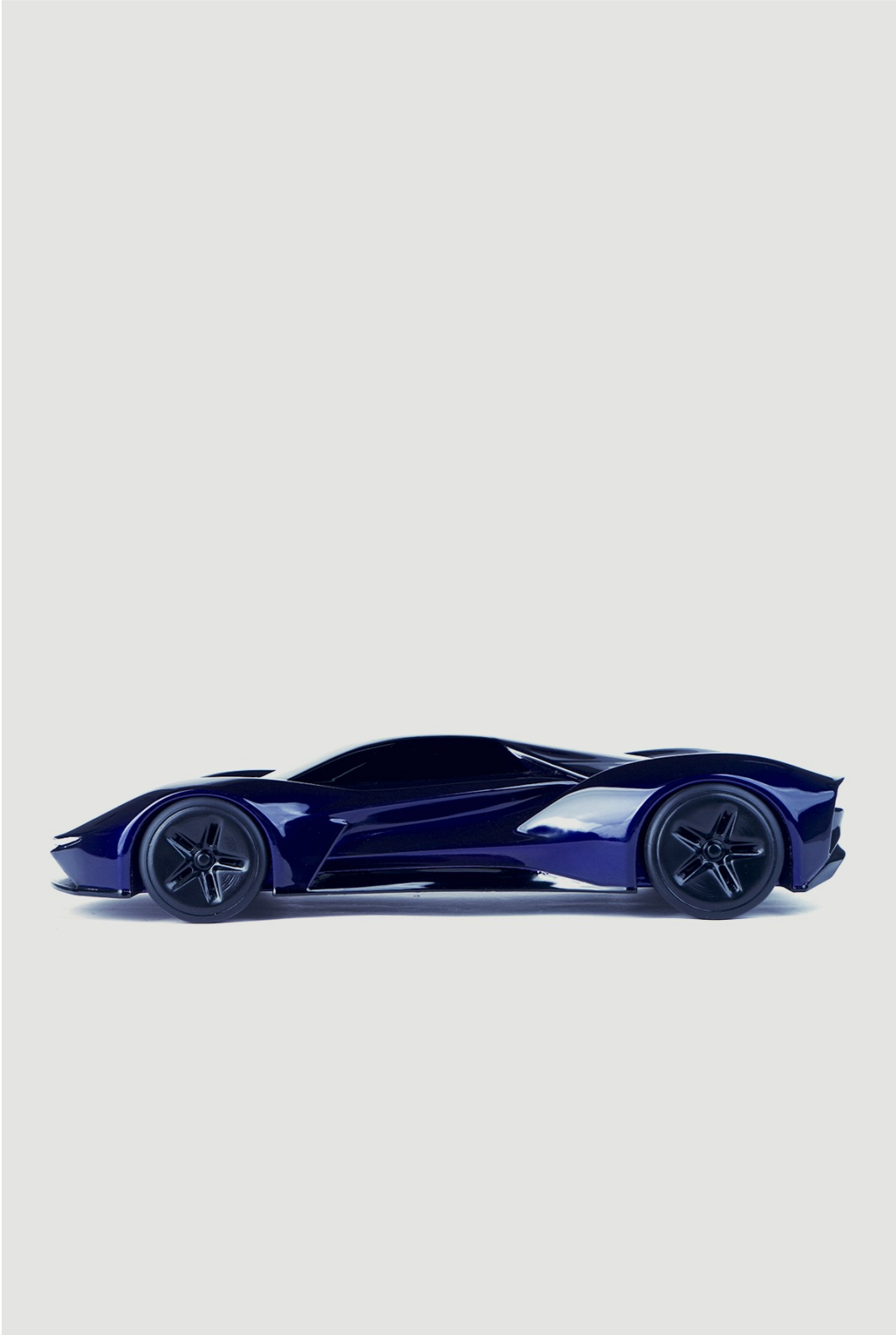
Gambar 4 - Tampak Samping Kanan