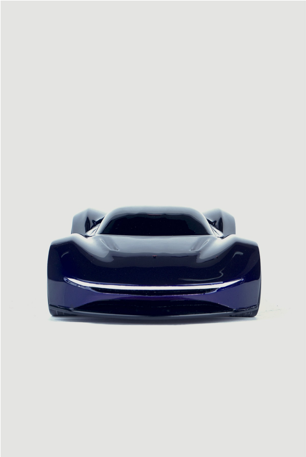
Gambar 2 - Tampak Depan