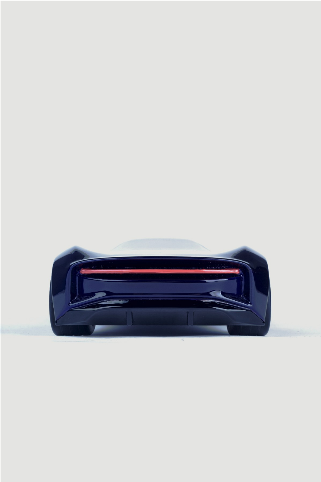
Gambar 3 - Tampak Belakang