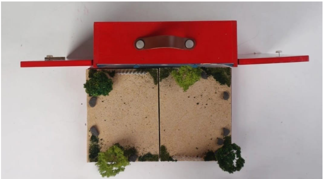
Gambar 6 - Tampak Atas