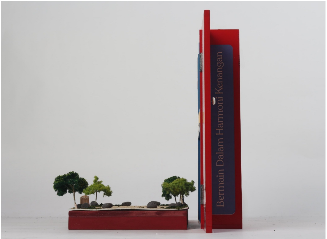
Gambar 4 - Tampak Samping Kanan