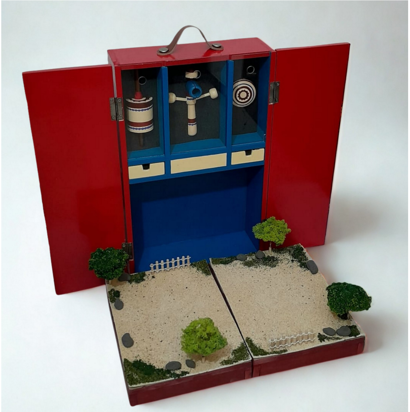
Gambar 1 - Tampak Perspektif