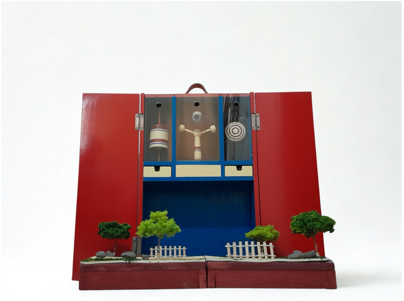
Gambar 2 - Tampak Depan