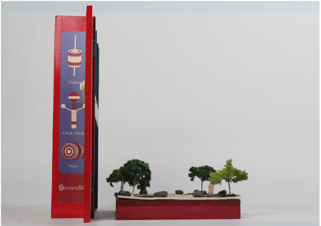
Gambar 5 - Tampak Samping Kiri