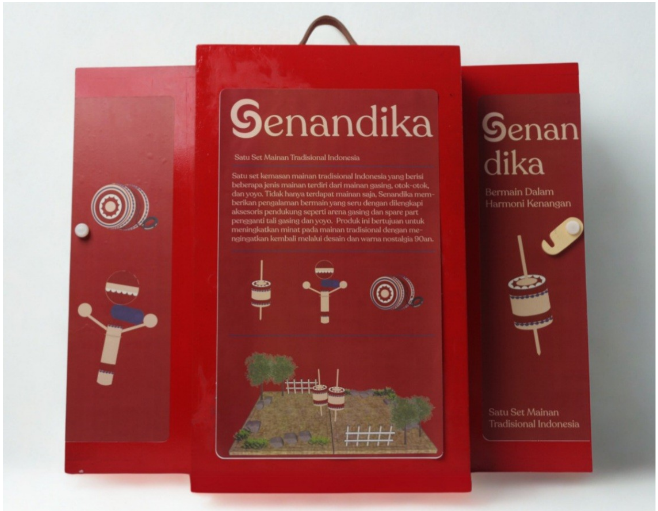
Gambar 3 - Tampak Belakang