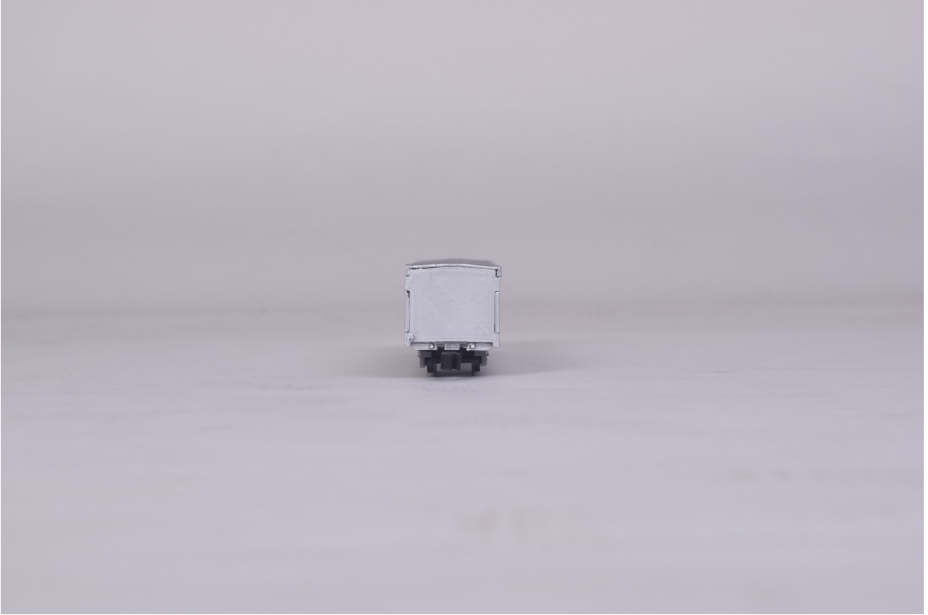
Gambar 3 - Tampak Belakang