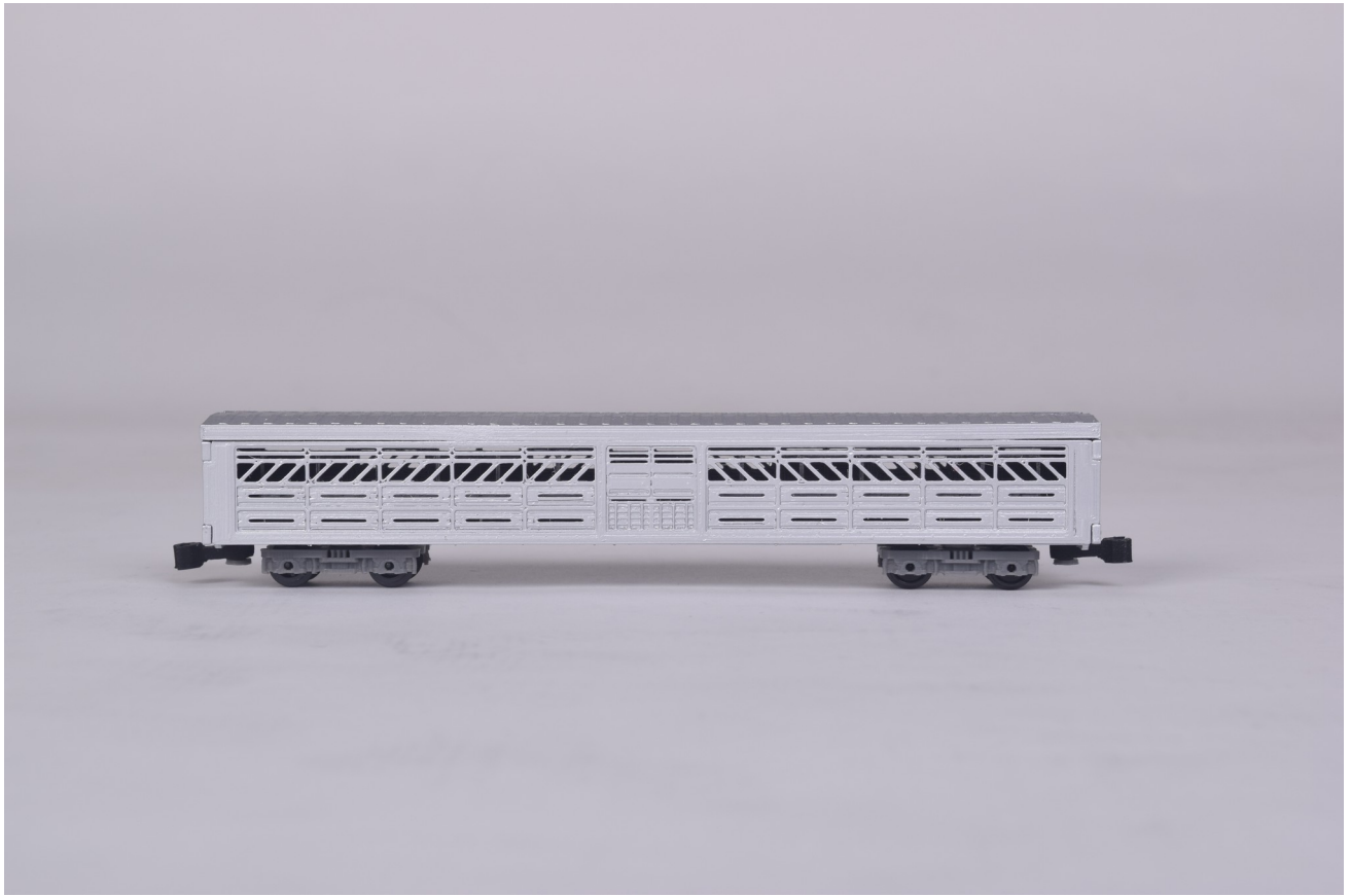
Gambar 5 - Tampak Samping Kiri