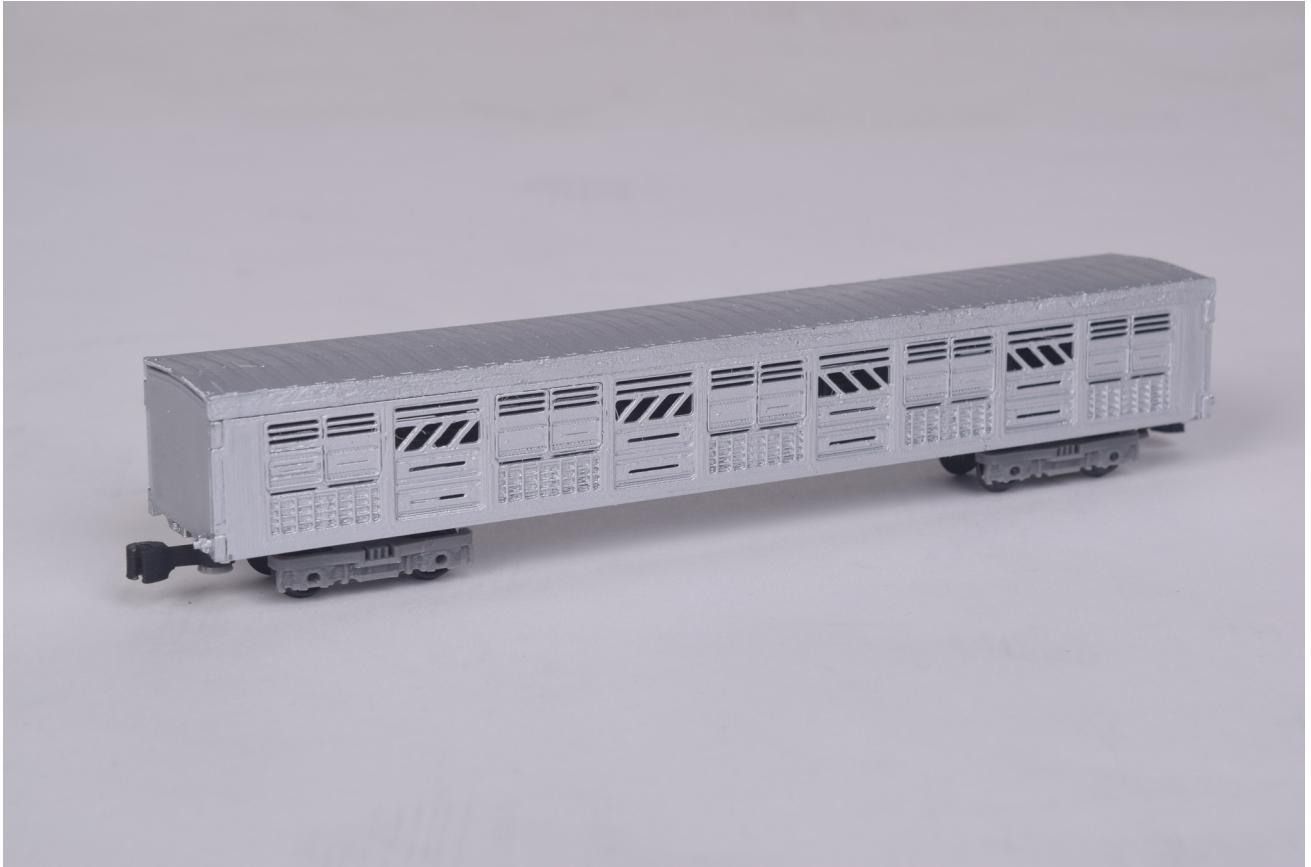
Gambar 1 - Tampak Perspektif