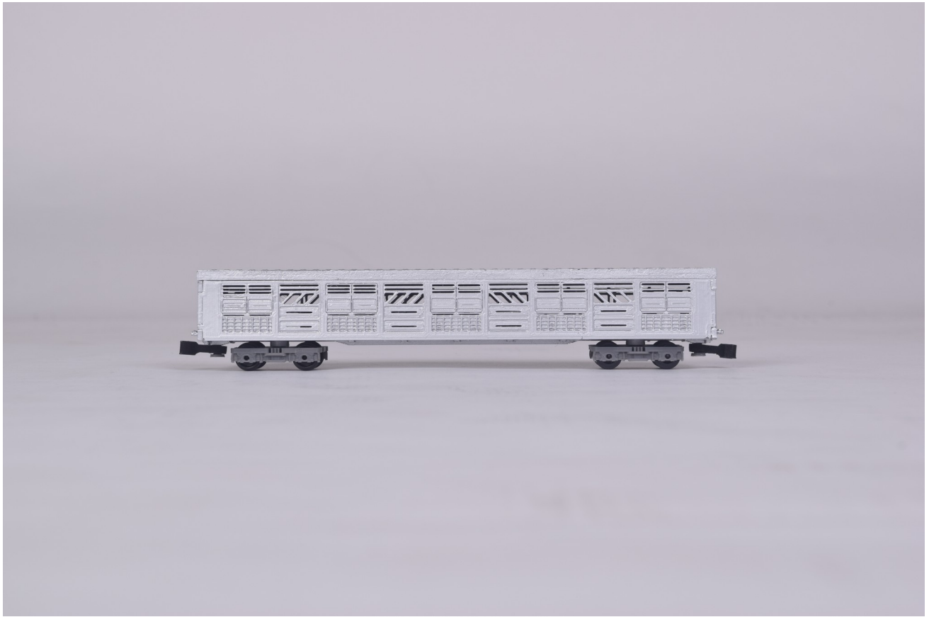
Gambar 4 - Tampak Samping Kanan