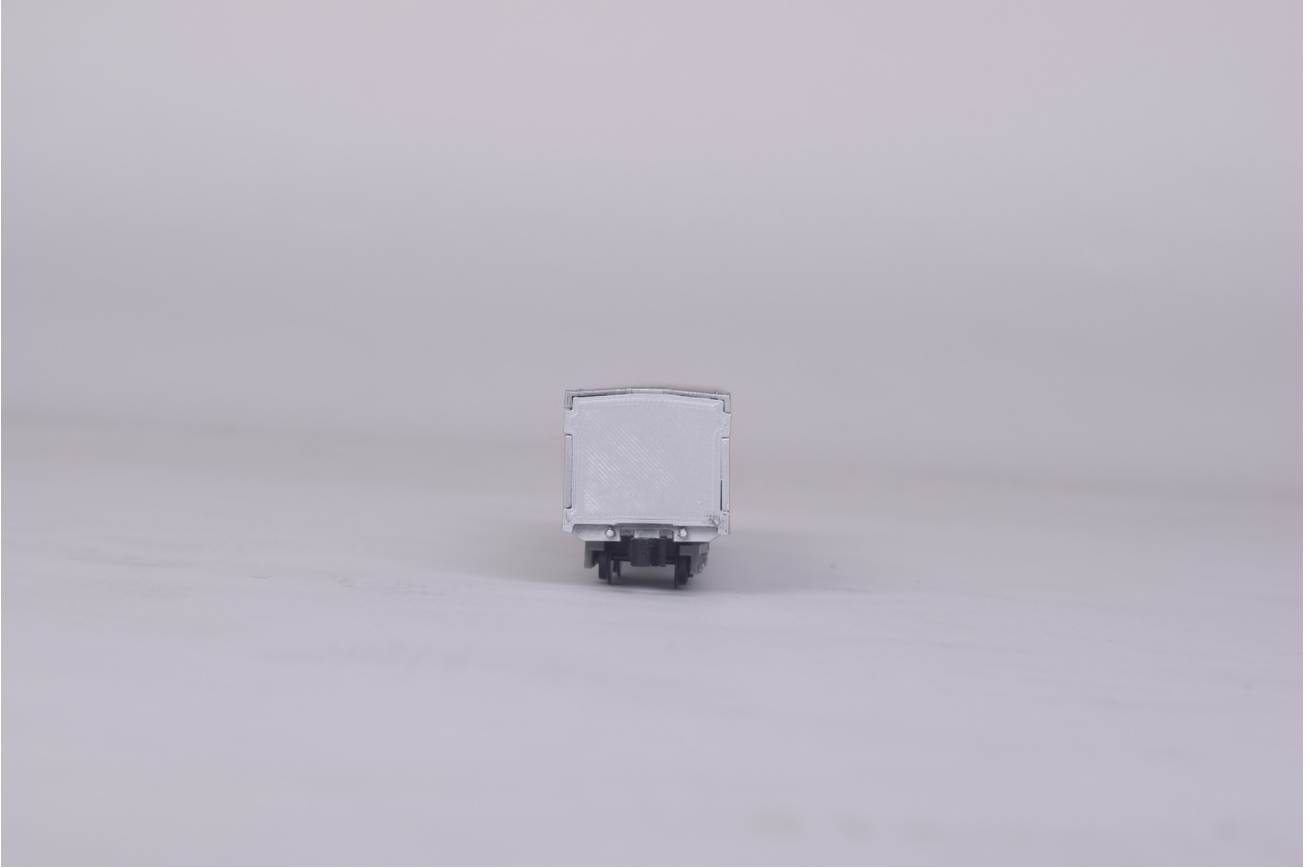
Gambar 2 - Tampak Depan