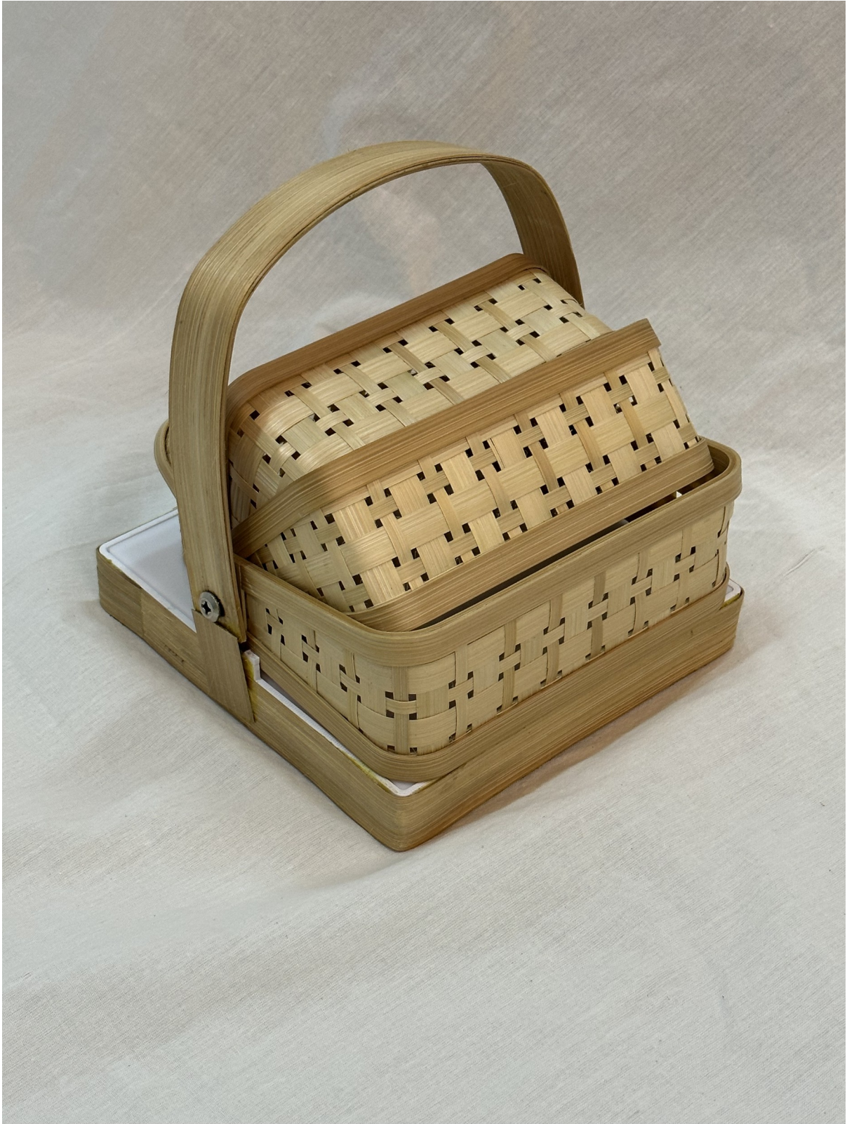
Gambar 1 - Tampak Perspektif