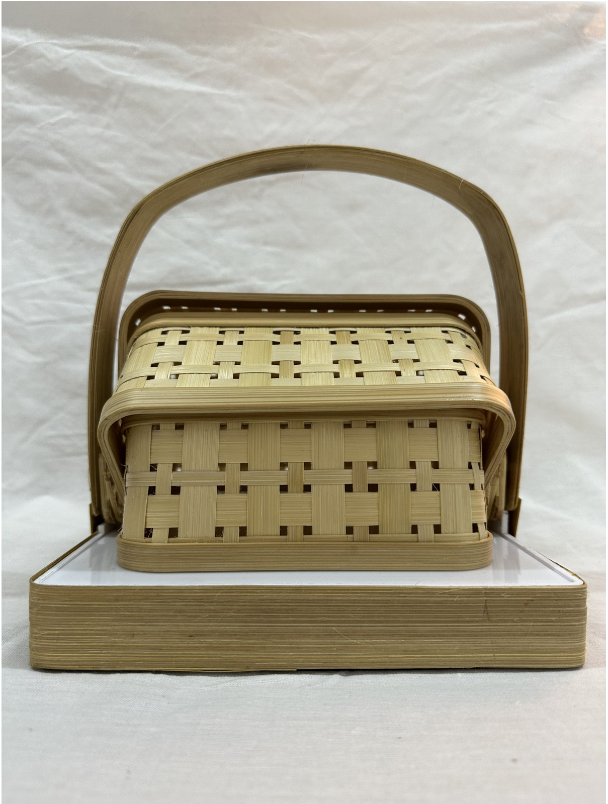
Gambar 3 - Tampak Belakang