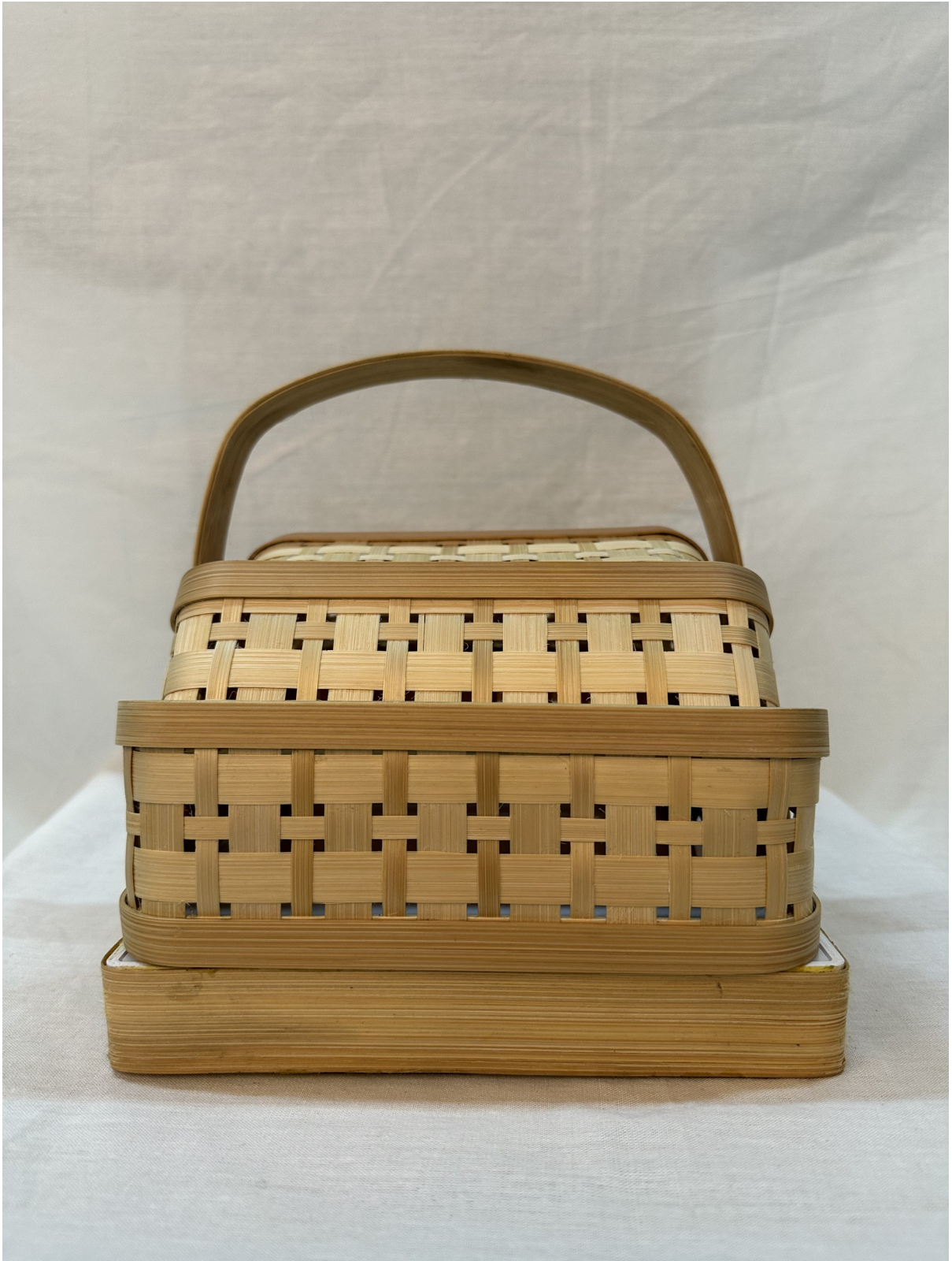
Gambar 2 - Tampak Depan