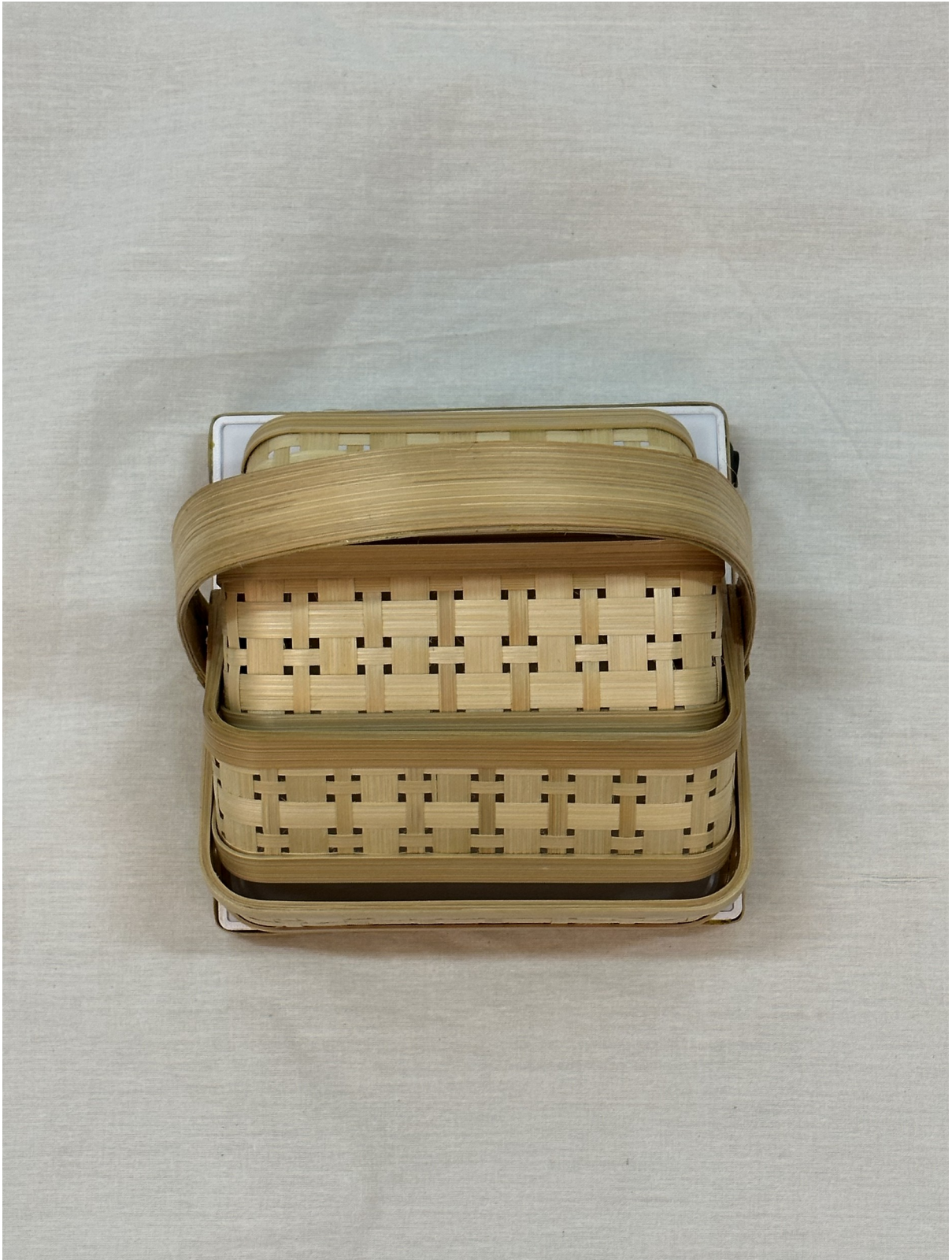
Gambar 6 - Tampak Atas