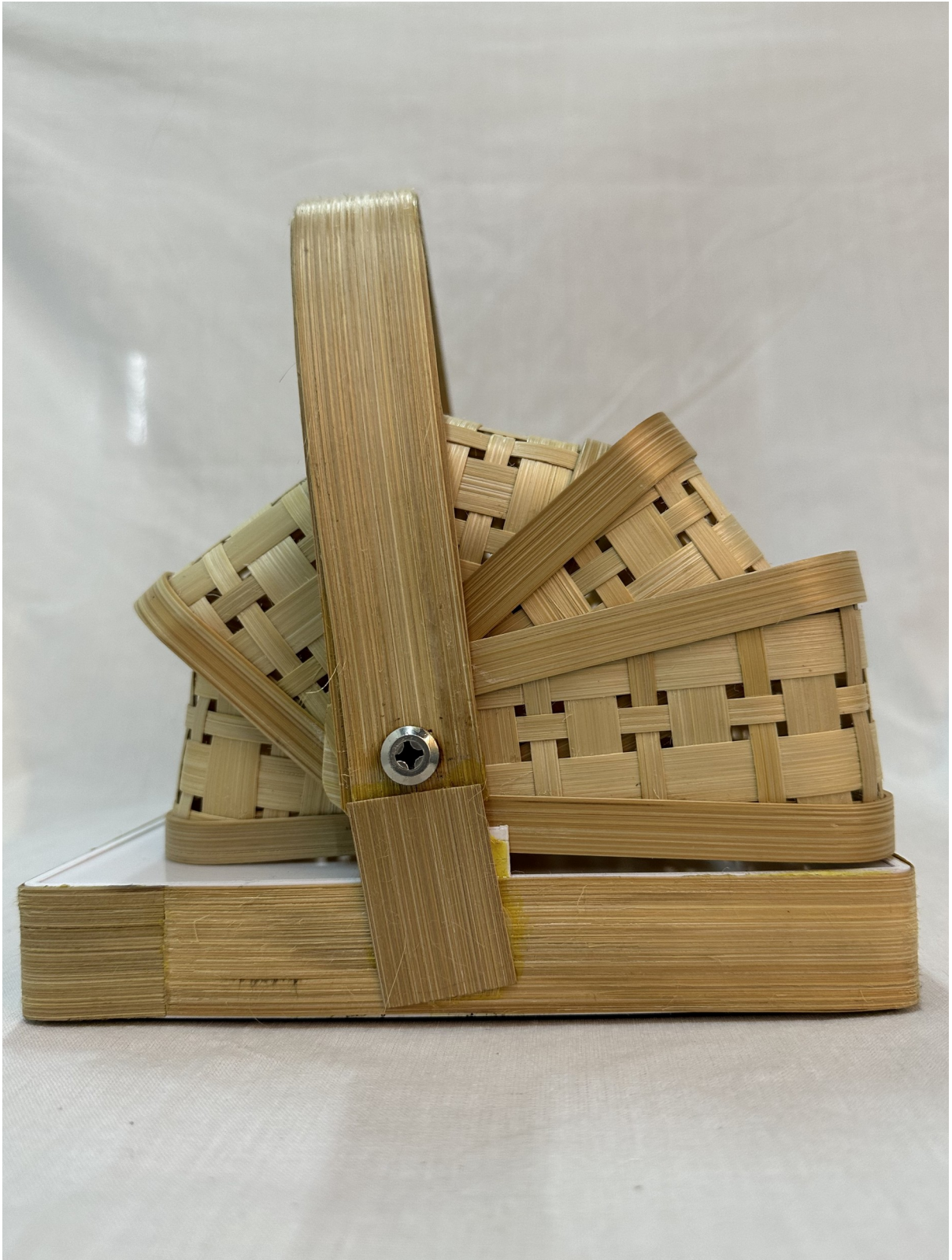
Gambar 5 - Tampak Samping Kiri