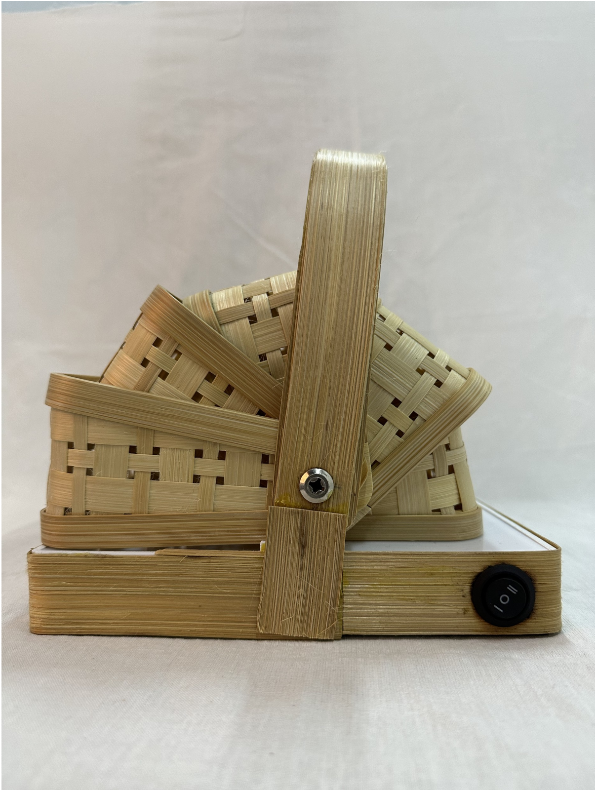
Gambar 4 - Tampak Samping Kanan