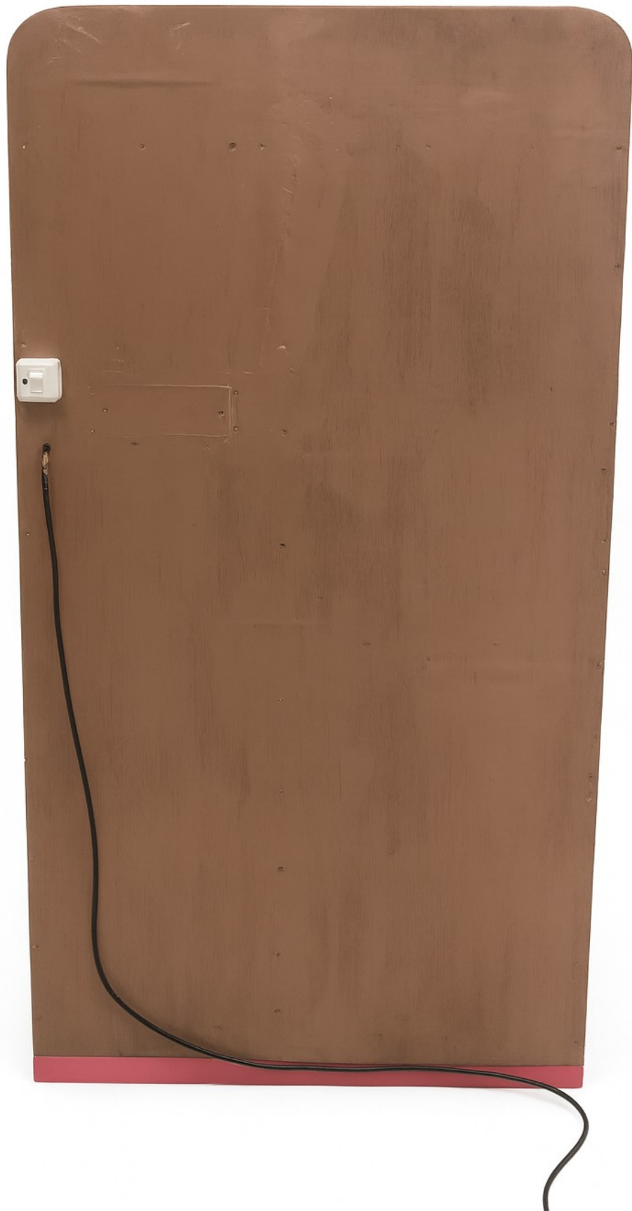
Gambar 3 - Tampak Belakang