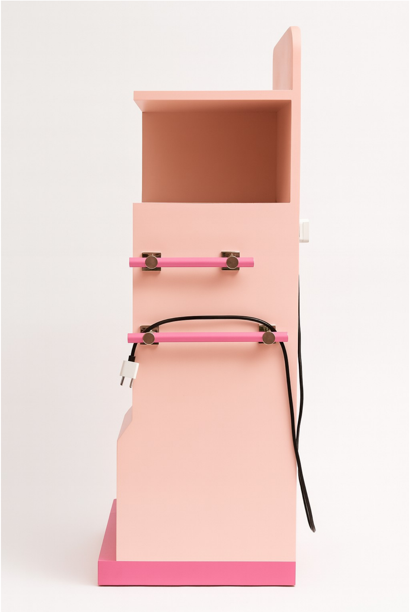
Gambar 4 - Tampak Samping Kanan