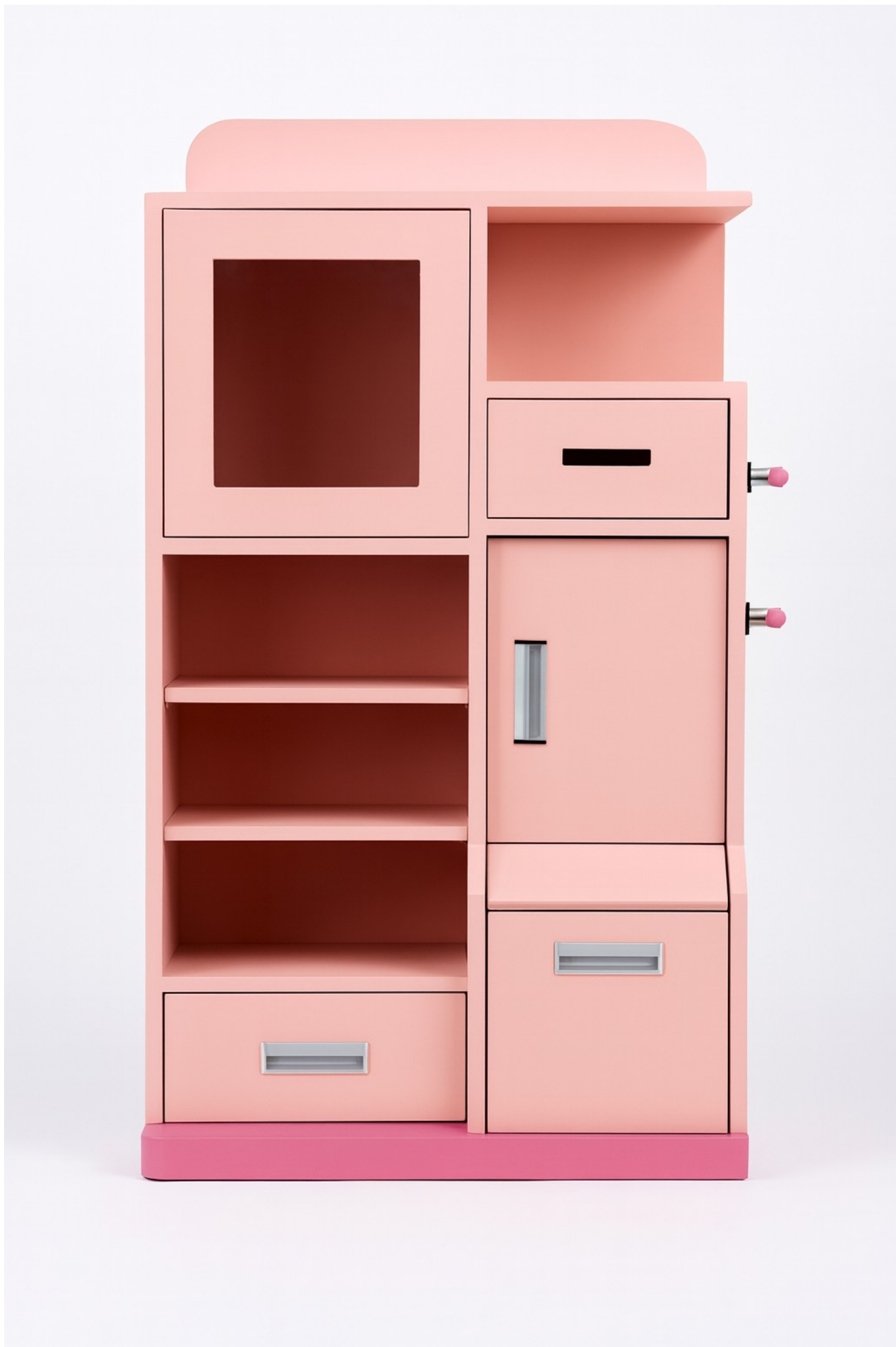
Gambar 2 - Tampak Depan