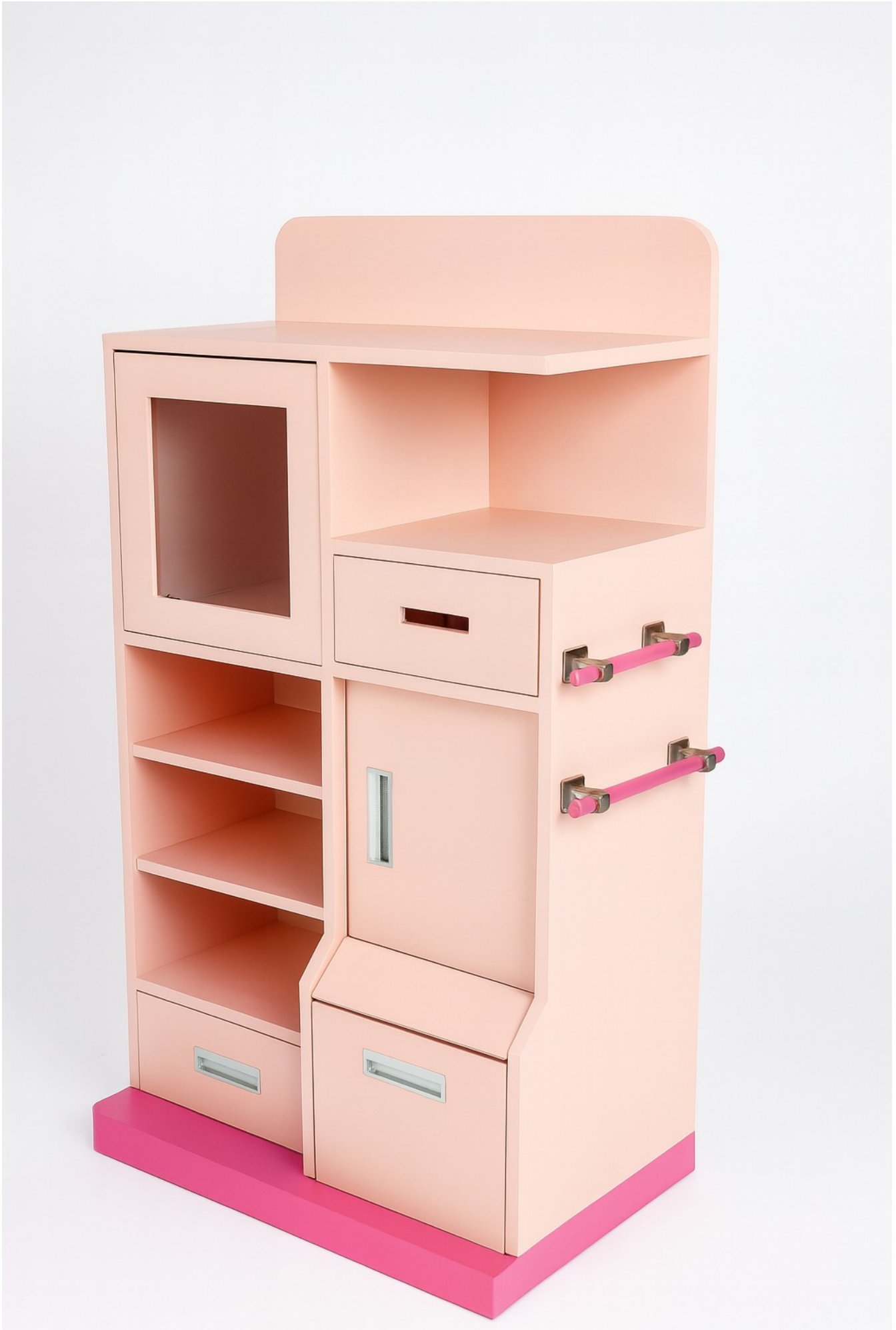
Gambar 1 - Tampak Perspektif