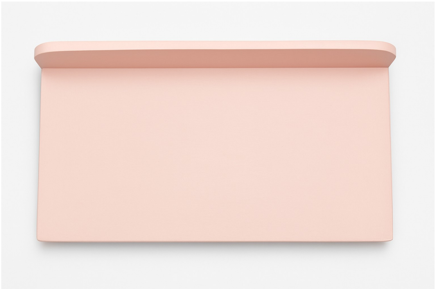
Gambar 6 - Tampak Atas